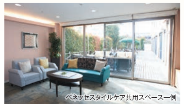
ベネッセスタイルケア共用スペース一例

ベネッセスタイルケアでは、感染症予防に細心の注意を払ってホームを運営しております。 ご来訪の皆様にはマスク着用、体温測定、手洗い、アルコール消毒等のご協力をお願いいたします。